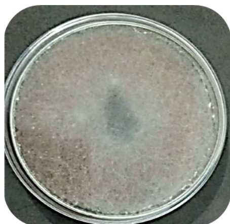
Fotografía 1. Aislamiento de Rhizopus sp en agar Sabouraud con 3 - 5 días de crecimiento.

Paico-Marín, S. Hongo del orden mucorales identificado en los ambientes del área Covid - 19 de un hospital de alta complejidad. Revista Del Cuerpo Médico Hospital Nacional Almanzor Aguinaga Asenjo, 2021, 14 ( S u p 1 ) , 7 9 - 8 0 . https://doi.org/10.35434/rcmhnaaa.2021.14Sup1.1178