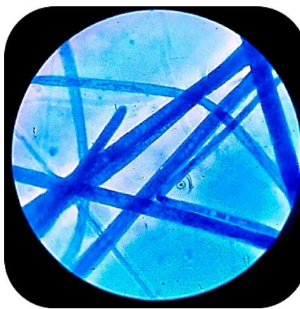
Fotografía 2. Aumento 400x. Se observa hifas no septadas que corresponde al orden mucorales. Con 3 - 4 días de crecimiento.