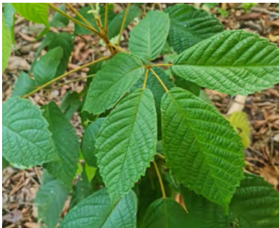
Foto N°12. Hojas de "Tahuari" Handroanthus obscurus (Bureau & K. Schum.) Mattos.