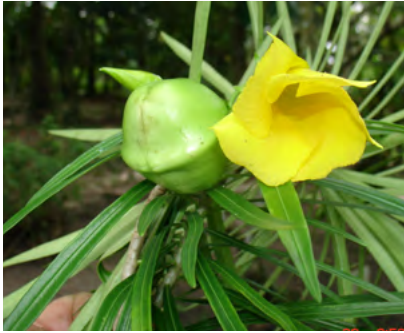
Foto N°7. Flores, frutos y semillas de "Bellaquillo" ( Cascavelia thevetia (L) Lippold)