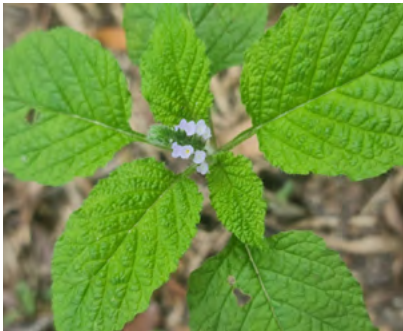
Foto N°29. Planta de "Cola de alacrán" ( Heliotropium indicum L.)