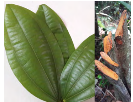
Foto N°31. Planta de "Abuta" ( Abuta grandifolia (Mart) Sandwith)