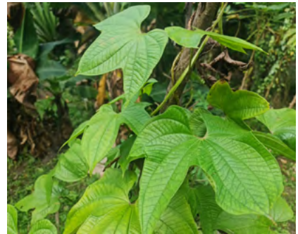
Foto N°20. Planta y raíces de "Scha papa" ( Dioscorea trifida L.)