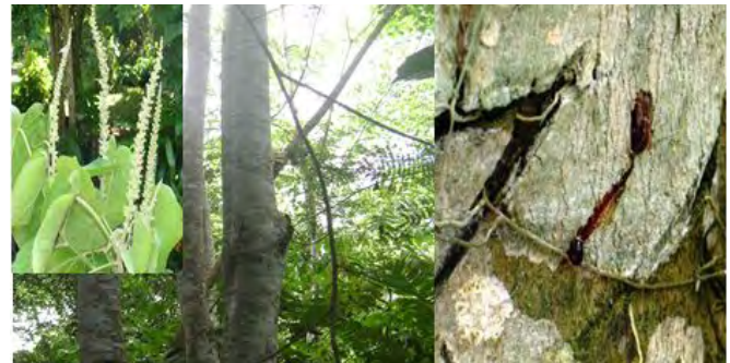
Foto N°22. PARbol, flores y Latex de "Sangre de grado" ( Croton lechleri Muell. Arg)