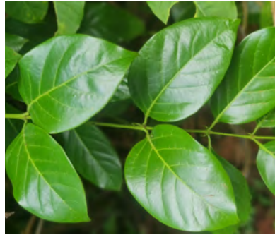
Foto N°39. Hojas de “Uña de gato” ( Uncaria guianensis (Aubl.)Gmel)