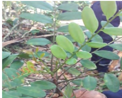
Foto N°42. Hojas, flores, frutos y Tallo de “Ayauma” ( Couroupita subsessilis Pilger)