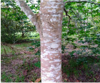
Foto N°26. Tallo y hojas de "Copaiba" ( Copaifera reticulata Ducke)