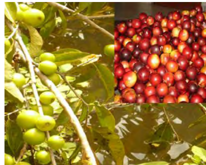
Foto N°33. Hojas y frutos de "Camu camu" ( Myrciaria Dubia (HBK) Mc Vaugh.)