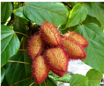
Foto N°14. Hojas, Frutos y semillas de "Achiote" ( Bixa orellana L.)