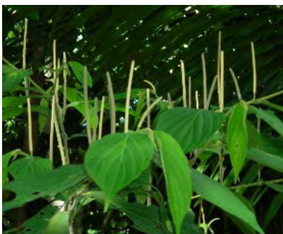
Foto N°35. Hojas e inflorescencias de "Cordoncillo" ( Piper aduncum L.)