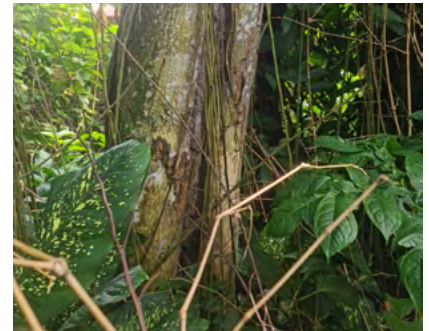
Foto N°11. Planta de "Tahuari" ( Handroanthus crisanthus (Jacq.) S.O Grose)