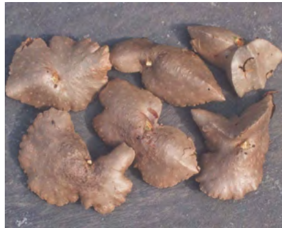
Foto N°19. Tuberculos aéreos de "Ñati papa" ( Dioscorea bulbifera L.)