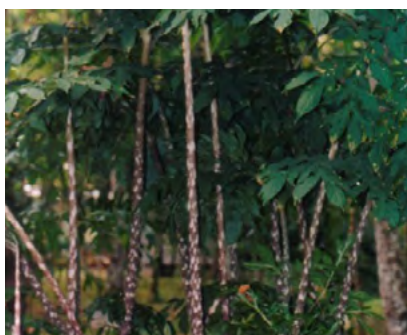
Foto N°6. Planta, cormos y cormelos de "jergón sacha" ( Dracontium lorentense Krause)