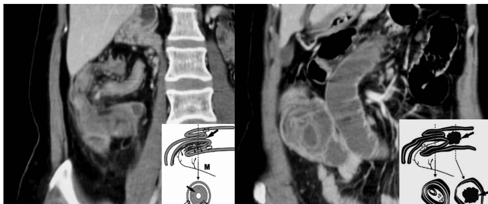
Figura 1. En el corte axial se observa conglomerado de asas intestinales en hemiabdomen derecho, que en conjunto miden 115x87x48mm con incremento de la ecogenicidad de la grasa periférica.

Evaluado por cirugía de emergencia y la unidad de hemorragia digestiva por historia de rectorragia con hematocrito 29%, tacto rectal: heces amarillas,